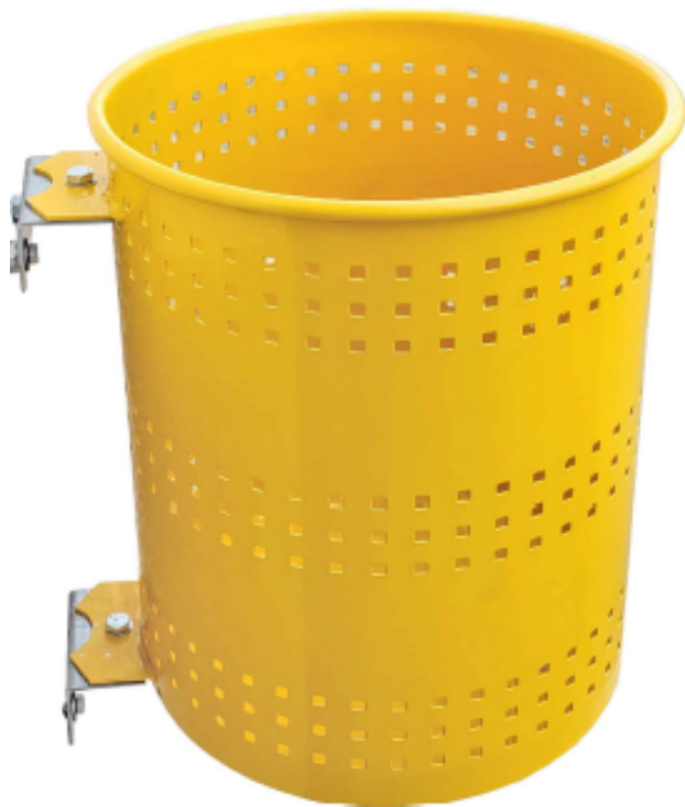
Detalle sujeción a la pared