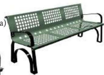
Verde RAL. 6002

Color a elegir sin coste adicional. - Tambien disponible en color gris oscuro(forja)