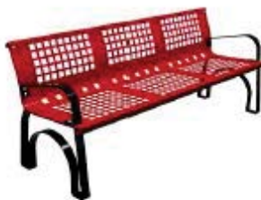
Rojo RAL. 3020