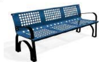
Azul RAL. 5015