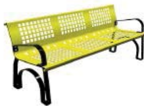
Amarillo RAL. 1003

Color a elegir sin coste adicional. - Tambien disponible en color gris oscuro(forja)